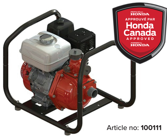
Article no: 100111

La pompe VS2-9W est équipée d'un moteur Honda de 9 HP et configurée pour être portable grâce à un cadre enveloppant.